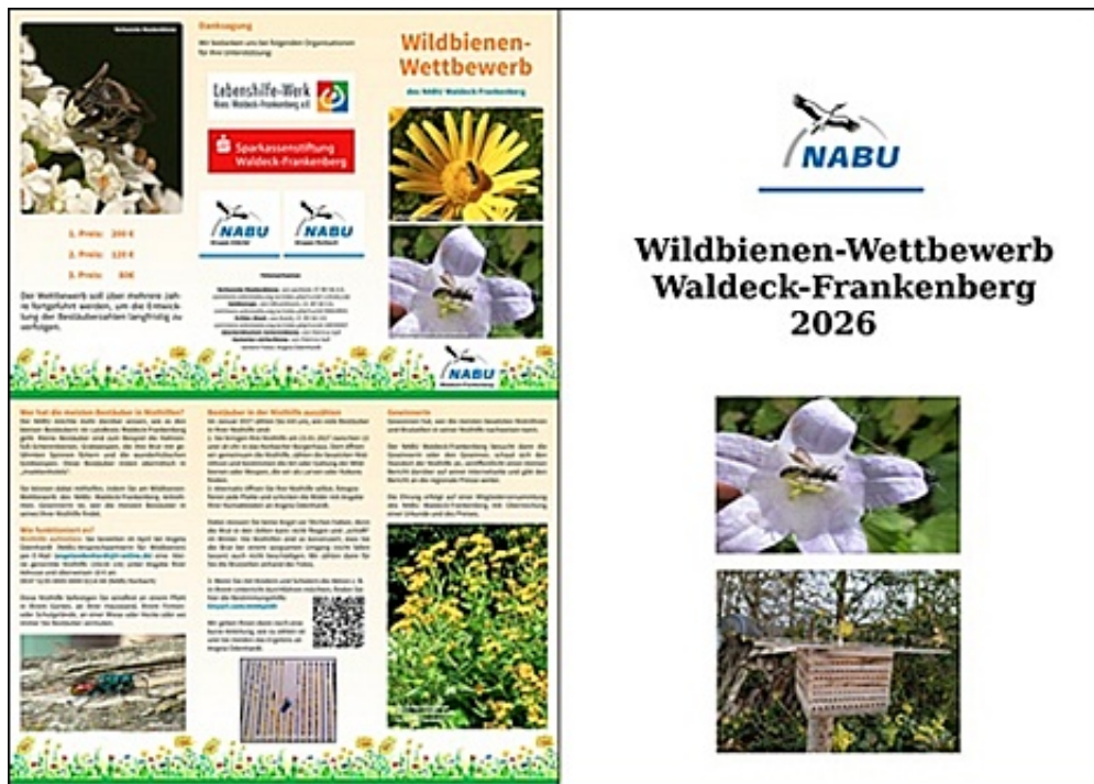
Flyer mit Infos und Bezugsadresse ( PDF )

(Dank an Franka Sembke für die Apparatzeichnung)