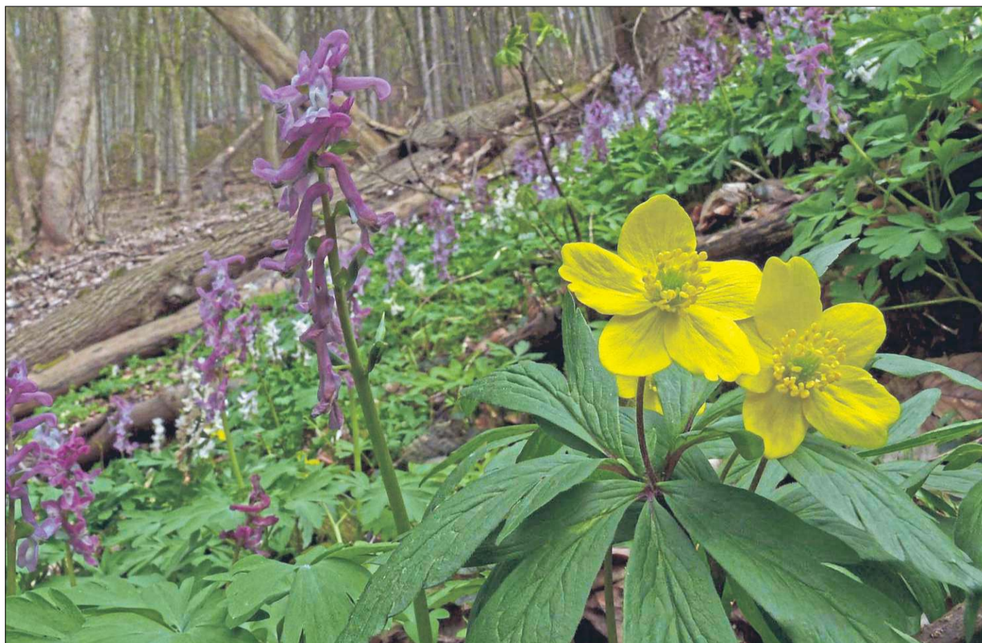
Schützenswerte Natur: An den Edersee-Steilhängen gibt es noch urwaldartige Bereiche, außerdem viele Pflanzen wie das Gelbe Buschwindröschen und den Lerchensporn.

ABO-Service: 0800-1560 300 (kostenlos) leserservice@wlz-online.de