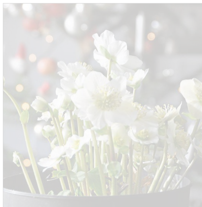
Christrose vor dem Tannenbaum.

Jeden Donnerstag von 15.30 bis 16.30 Uhr können Sie, liebe Leserinnen und Leser, Ihre Fragen rund um den Garten bei der Redaktion der Waldeckischen Landeszeitung unter Telefon 05631/560-152 loswerden. Wir geben die Fragen an Experten weiter und veröffentlichen die Antworten auf der nächsten Gartenseite. (md)