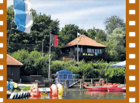
Die DLRG-Wachstation ist während der Sommermonate rund um die Uhr besetzt.