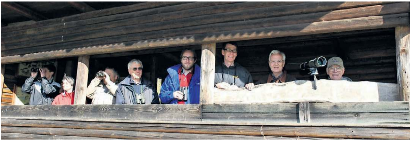
Die Beobachtungshütte am Rande des Naturschutzgebietes ermöglicht den geduldigen Vogelschützern intime Einblicke in das Brutverhalten der unzähligen Vogelarten, die sich hier am See wohlfühlen.