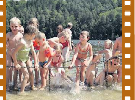
Sommerfreuden am Strandbad: Hier können Kinder toben und Familien entspannen.