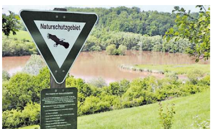
Das Naturschutzgebiet am Twistesee ist ein Paradies für Pflanzen und Tiere.