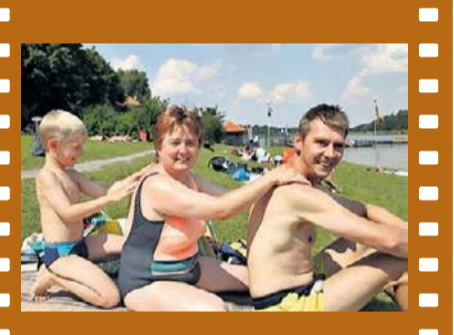
Urlauber am Twistesee-Strandbad.