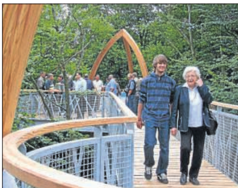
Soll erweitert werden: der Baumkronenweg am Eschelsberg.

Während dafür im Hainich-Nationalpark ein Betonturm gebaut wurde, ist der Baumkronenpfad am Edersee recht gut in die Landschaft eingepasst. Eine Erweiterung, die das Landschaftsbild nicht beeinträchtigt, ist geplant. Optimierte werden sollten die Informationen zum artenreichen Lebensraum Baumkronen. Daran will der NABU fachlich mitarbeiten.