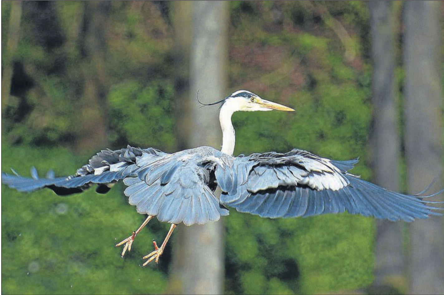
Fällt unter die besonders geschützten Arten: der Graureiher. Nach Jahrzehnten wurde im Edertal wieder eine Kolonie mit fünf Brutpaaren registriert.

Am Storchenhorst an der Wesermündung in Gifflitz will der Naturschutzbund einen Info-Stand anbieten. Mit Fernrohren (Spektiven) können die Radler beobachten, was sich auf dem Horst tut.