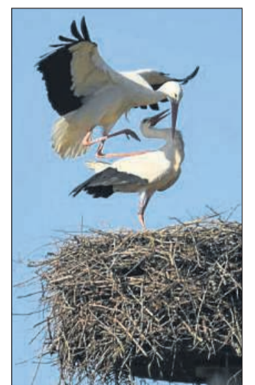
Inzwischen ist Nachwuchs da: Die Störche im Horst an der Wesermündung.

Außerdem wurde eine Ausgleichsfläche zwischen Mehlen und Gifflitz eingegattert und eine Obstbaumreihe gepflanzt. Die Fläche wird von Georg Schutte mit Schafen beweidet, der auch Flächen für den NABU Edertal pflügt.