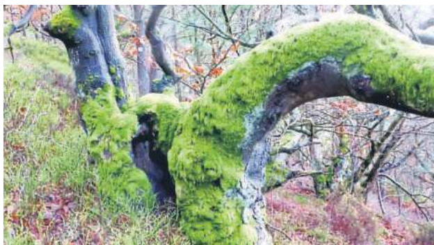
Lebensgemeinschaften: Moose auf Bäumen und ein Teppich aus Rentierflechten am Rand des Hutewalds.