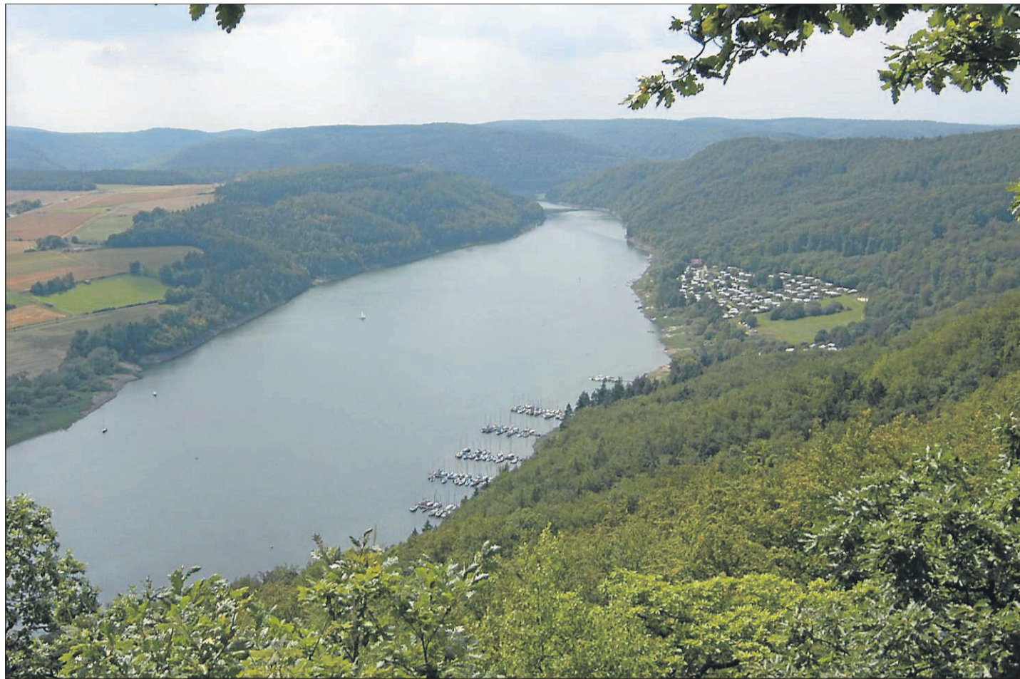
Schätze bewahren: Die Ederseesteilhänge, hier von der Kahlen Haardt fotografiert, wurden als Schutzgebiete ausgewiesen. Das Regierungspräsidium arbeitet an einem Plan, um die Vorgaben umzusetzen. Ausgenommen sind die stillgelegten Flächen des Landes.

ABO-Service: 0800-1560 300 (kostenlos) leserservice@wlz-online.de