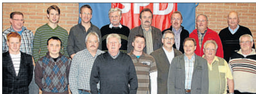
Sie gehen in die Wahl: Die Twistetaler SPD hat ihre Liste der Kandidaten aufgestellt, die sich Ende März zur Wahl stellen.