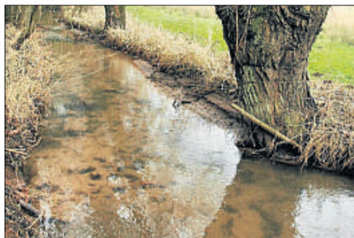
Am Mühlengraben: Durch den zunehmenden Schlamm steigt am Vorstau die Sorge vor Verlandung.