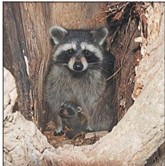
Die Waschbärenfamilie hat Dieter Bark in einer Kopfweide bei Wormeln entdeckt.