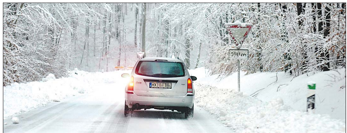
Besonders betroffen von Schneeverwehungen waren Randbereiche der Städte Willebadessen und Borgentreich. Unfälle gab es nicht.

Die Verantwortlichen in den drei Städten haben unterdessen auch die Schneelast auf ihren Gebäuden im Blick, sehen die momentane Situation aber als unbedenklich an. »Die Schneehöhe hat am Mittwochvormittag zehn Zentimeter betragen, das ist statisch unbedenklich«, so Güntermann, »kritisches könnte es erst ab 40, 45 Zentimetern werden«.