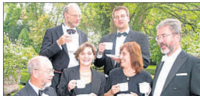
Heimische Musiker: Das Ensemble Cappuccino gastiert beim Neujahrskonzert im Bürgerhaus Hemfurth-Edersee.

Karten zum Neujahrskonzert gibt es im Vorverkauf bei der Gemeinde Edertal und in der Edertal-Apotheke in Bergheim für acht Euro, an der Abendkasse zehn Euro. (zcm)