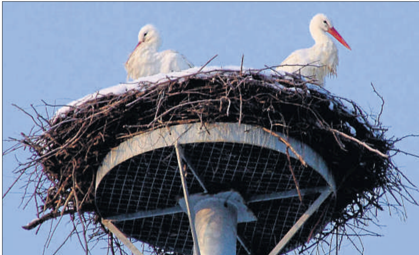
Alter und Herkunft geklärt: Einer dieser beiden Weißstörche, die im Dezember überraschend im Edertal aufgetaucht waren, erblickte 2003 im schweizerischen Warth (Kanton Thurgau) das Licht der Welt.

Zeitungsstellung: 05631/97 46-0 oder 0180/12 12 122