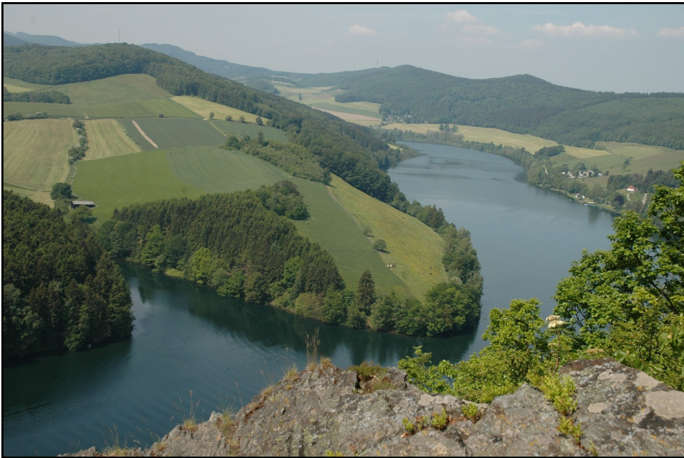
Blick vom St. Muffert auf den Diemelsee